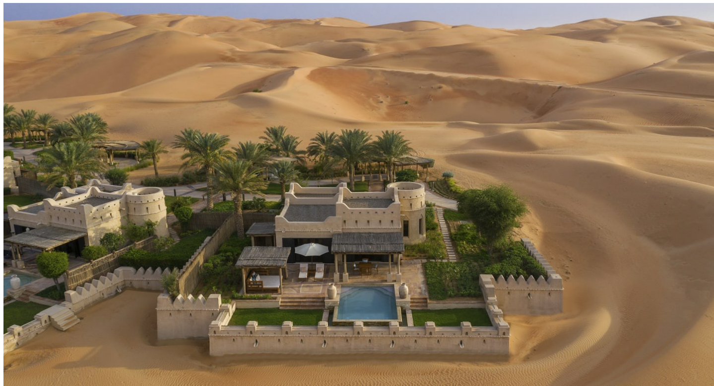
Mahdar bin Usayyan | Liwa Desert

Eine Oase der Ruhe und Erholung, die an Eleganz kaum zu überbieten ist. Ein Wellness-Paradies mit einer Atmosphäre zum Wohlfühlen.